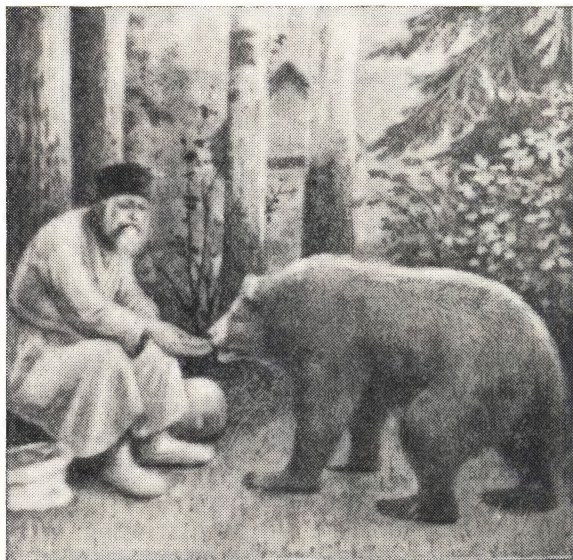
ПРЕПОДОБНЫЙ СЕРАФИМ, КОРМЯЩИЙ МЕДВЕДЯ ХЛЕБОМ